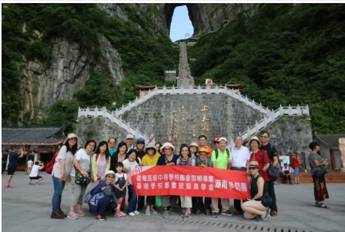
天門山國家森林公園團照

7月26日我們展開張家界著名景區的遊覽，張家界，相傳漢代留侯張良隱居於此而得名。走訪張家界，不管走到哪裡，不經意間看到聽到的歷史典故、民間傳說、風土人情、飲食風俗，往往都與土家文化相關，帶有鮮明的地域色彩。我們抱著雀躍的心情，搭乘纜車去遊覽天門山國家森林公園，天門山海拔1518.6米，是張家界永定區最高的山，纜車南北對開於千巖素壁之上，乘坐在纜車上遠眺車外景觀，巍峨高絕的山壁，氣勢磅礴，是罕見的高海拔穿山溶洞，堪稱鬼斧神工造化神奇的冠世奇觀。俯視蜿蜒的山路，猶如一條白色絲帶，環保車穿梭其中，天空上的纜車與公路上的環保車相映成趣，令人歎為觀止。從纜車下來，我們往天門山景區鬼谷棧道前進，因懸於鬼谷洞上側的峭壁沿線而得名。站在棧道上俯瞰群山，令人油然而生「會當凌絕頂，一覽眾山小」的感覺。接著我們行走在天空步道上，遠眺玻璃棧道外美麗的風景，蒼鬱的樹林生長在懸崖峭壁間，令人有「心凝形釋，與萬化冥合」的美感，頓時暑氣全消。