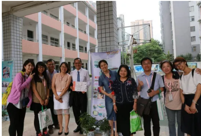
臺灣學校圖書館學會會員與梁主席、東郡小學校長合影