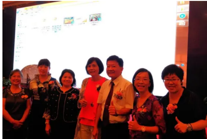
臺灣圖書館館員學會會員與香港貴賓合影