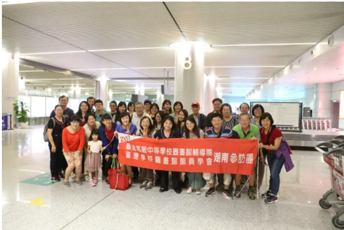
湖南長沙機場團照

*國立中壢家事商業職業學校前圖書館主任，臺北市立大學通識中心、國立臺灣海洋大學共同教育中心、私立新生醫專通識中心兼任助理教授。