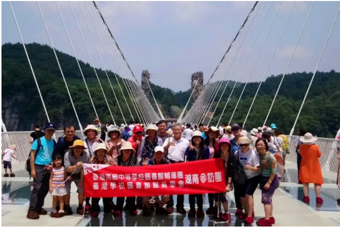
雲天渡玻璃橋團照

人震撼。接著我們去參觀位於張家界慈利縣三官寺鄉的大峽谷景區，在這裡可觀賞到北溫帶喀斯特地形的全部風景。大家小心翼翼的沿著垂直陡下的階梯，一步一腳印的往下走。也讓我們目睹張家界奇峰異石的峽谷地貌，令人有「一峰突起眾峰環」如詩如畫的美感。誠如張家界一則順口溜：「不來想死人，來了累死人。」的確，到張家界旅遊，整天坐車、走路、爬山真的很累人。我們此行以尋幽探勝的心情去探訪大自然的美景，飽覽了湖南張家界的山水勝景，讓我們更深切感受張潮在《幽夢影》一書中所說：「文章是案頭山水，山水是地上文章」的意涵。