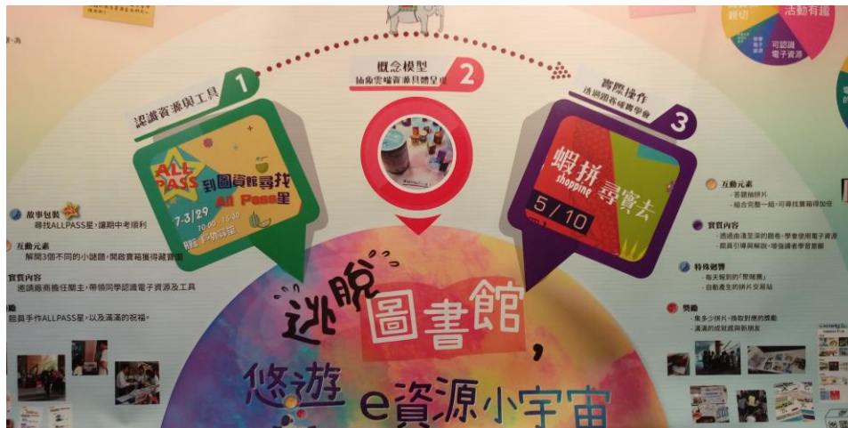
高雄餐旅大學圖書資訊館以「逃脫圖書館」為主題

師範大學圖書館展出「校史數位與加值應用」，該館設立數位校史館，有影音、圖像、數位展覽及虛擬導覽，該館陸續舉辦過 20 多次校史相關的展覽，如劉真、梁實秋、王振鵠、李華偉等主題，也曾經舉辦研討會並出版《校史解碼：數位典藏與校史經營研究論文集》，該館另展出圖書館文創推廣。