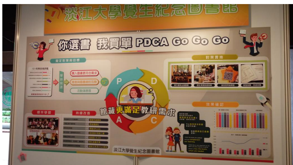
淡江大學圖書館推出「你選書，我買單」

淡江大學圖書館邀請書商在各學院舉辦選書活動，由學生參與選書，館員能與讀者互動，圖書館也得到認同，一舉數得，參與學生從 104 學年度的 1,899 人次到 107 學年度第 1 學期的 3,536 人次，逐年上升。台北醫學大學圖書館除了邀請書商來學校之外，更與附近的「信義誠品」合作，學生可到「誠品」選購書刊。