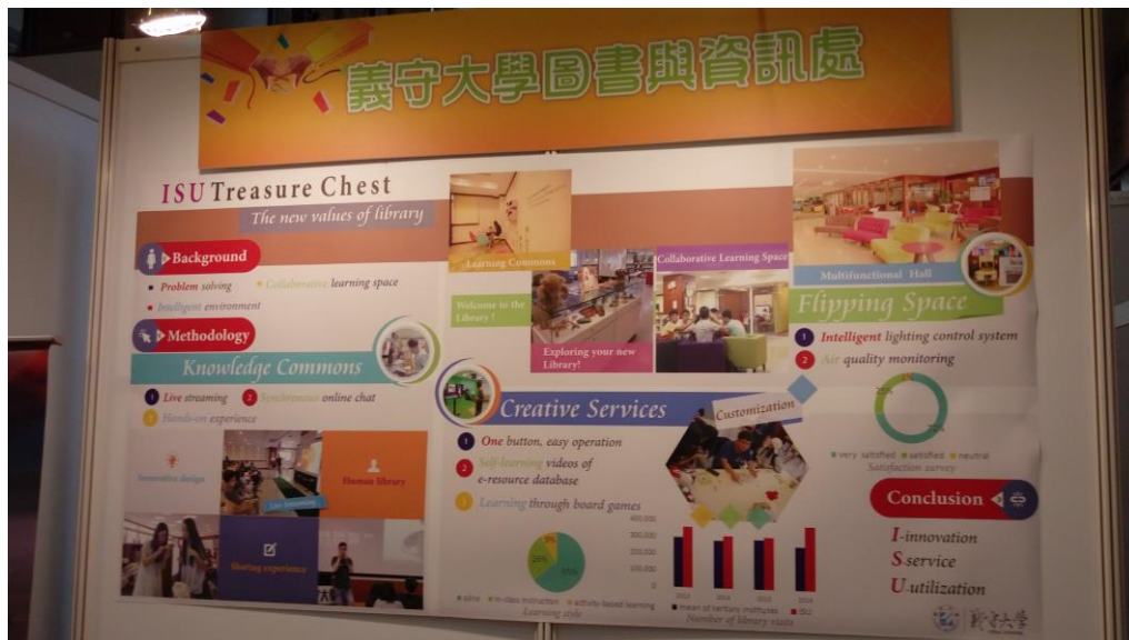
義守大學圖書與資訊處的雙語海報色彩豔麗、圖文並茂

今年的海報展以「大學圖書館經營與創新」為主題，由圖書館學會和技專校院、大學校院兩個圖書館委員會共同辦理，範圍涵括了館藏資料、專業教育、行銷推廣及創意亮點等。參展的作品要經過初步甄選，入選者由學會補助交通費在年會展出，並舉行票選，前三名學會將補助經費參加 2019 年 ALA、IFLA 及 MLA 年會海報展，這個甄選的過程嚴謹又周全，具有吸引力和多方面的效益。此外，在年會之前，學會大學校院圖書館委員會延續過去，舉辦「2018 大專校院圖書館精進與創新競賽」，廣為徵求館務「亮點」，以相互觀摩，激發創新，改善實務。由於這兩個活動前後銜接，有些圖書館同時報名參加，甚至在兩項活動中都被入選，雙喜臨門，令人激賞。