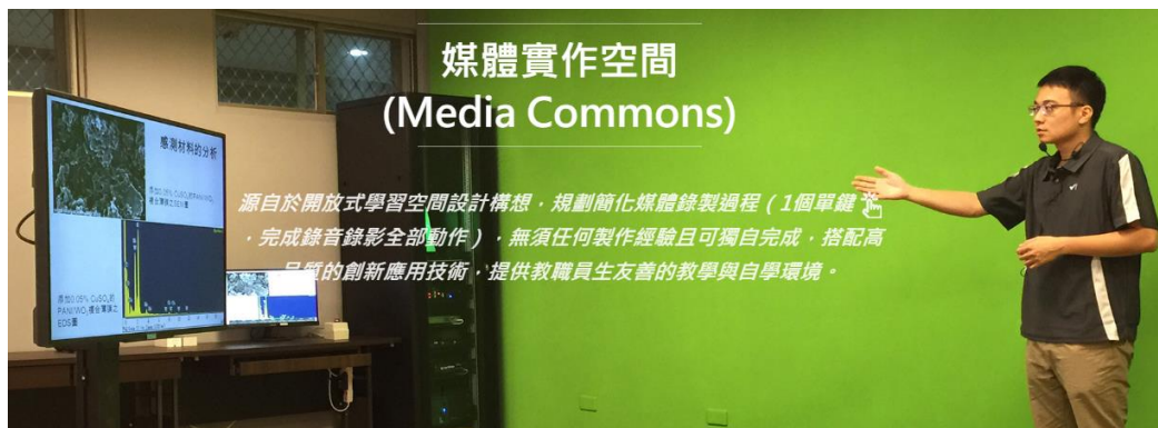
義守大學圖書與資訊處「媒體實作空間」(義守大學圖書與資訊處, 2019)

義守大學強調數位教學，設立「媒體實作空間」，以一鍵化(One button finish)方式進行媒體錄製，提供師生錄製影音、準備簡報或進行排練，他們甚至將設備帶到海報展覽現場供人操作。