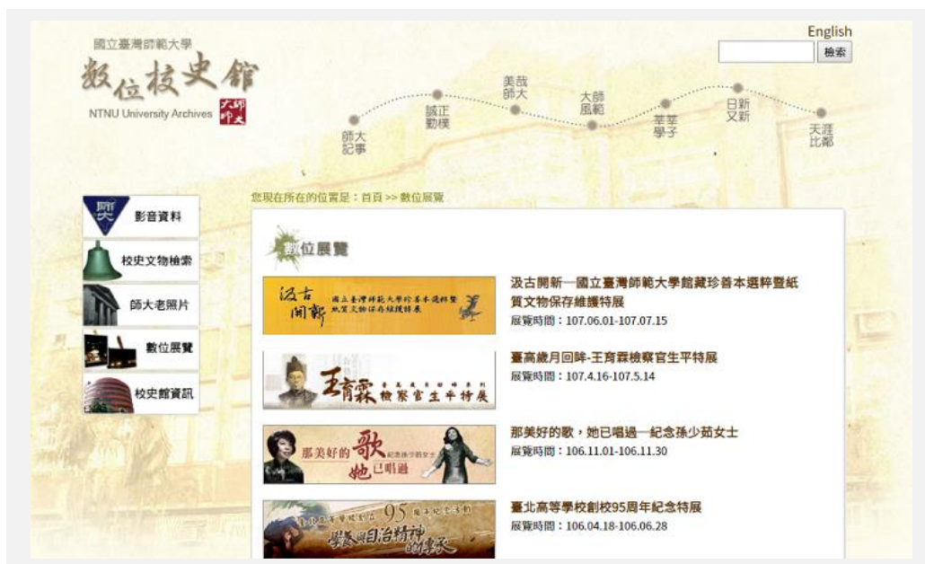
師範大學圖書館數位校史館網頁

師範大學圖書館展出「校史數位與加值應用」，該館設立數位校史館，有影音、圖像、數位展覽及虛擬導覽，該館陸續舉辦過 20 多次校史相關的展覽，如劉真、梁實秋、王振鵠、李華偉等主題，也曾經舉辦研討會並出版《校史解碼：數位典藏與校史經營研究論文集》，該館另展出圖書館文創推廣。