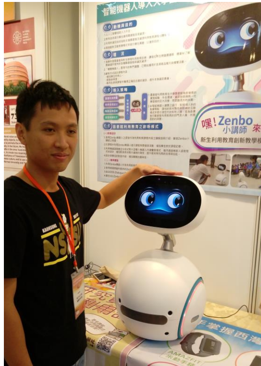
中山大學 圖書資訊 處 Zenbo 小講師在 會場內到 處賣萌

台東大學利用人臉辨識技術作「刷臉借書」；文藻大學以 3D 列印桌遊。導入虛擬實境有南台科大、師範大學和正修科大等校圖書館，南台科大和國家圖書館合作，取才於清代郁永河的《裨海紀遊》，以數位來模擬實景，具有環場效果，是閱讀古籍的另類體驗，也是古為今用的好例子。