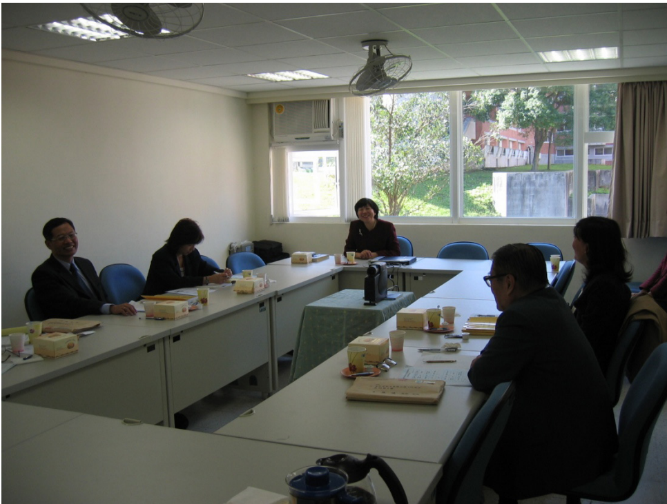
圖 2: 2013 年 11 月 14 日政治大學圖書資訊學研究所自評請王教授指導