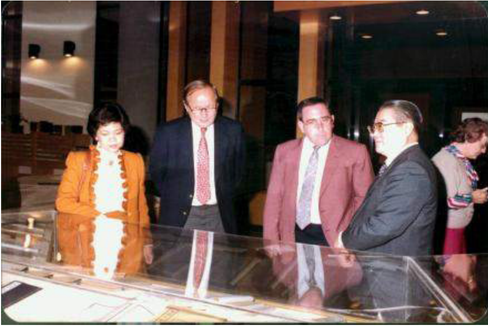
圖 1: 1987 年帶逢甲大學外賓參訪國家圖書館善本室蒙王館長親自接待