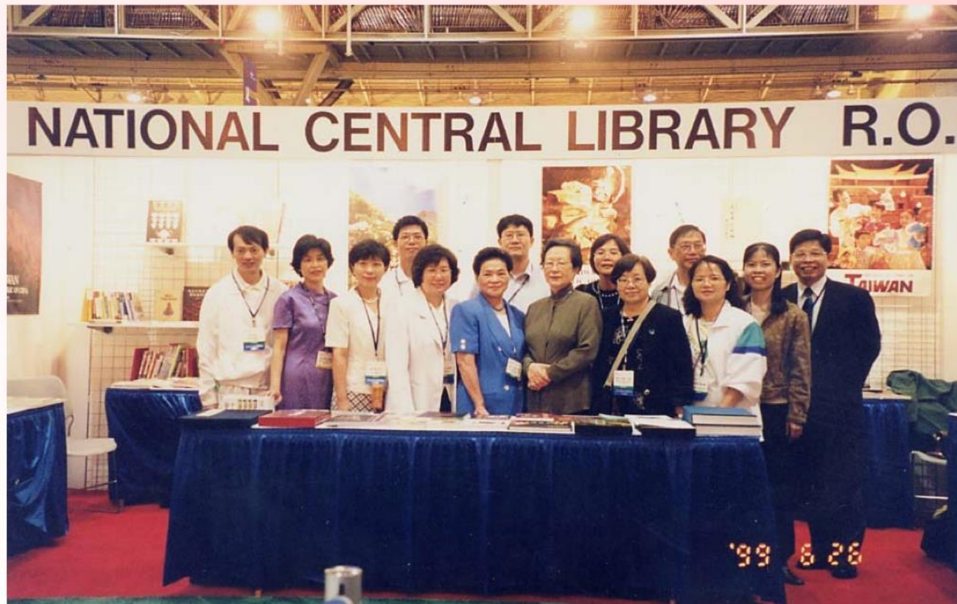
國家圖書館於 ALA 108 屆年會參加書展， 台灣代表攝於國圖攤位前