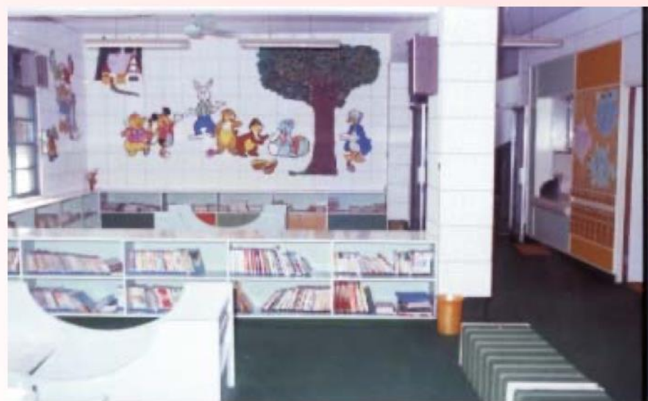
台灣師大兒童圖書館內景