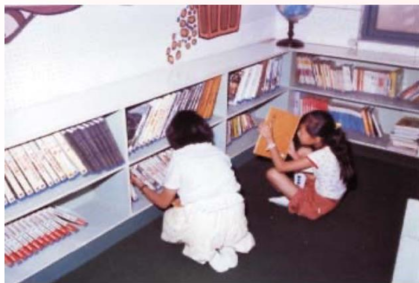
台灣師大兒童圖書館一隅