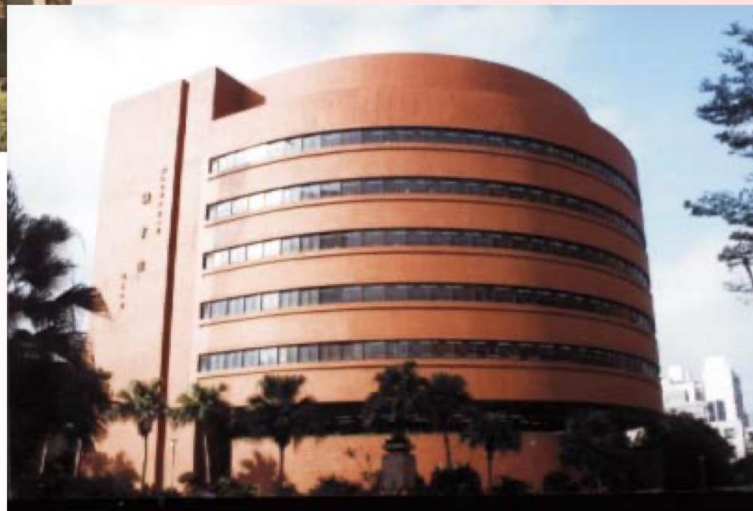
台灣師大圖書館新館外觀