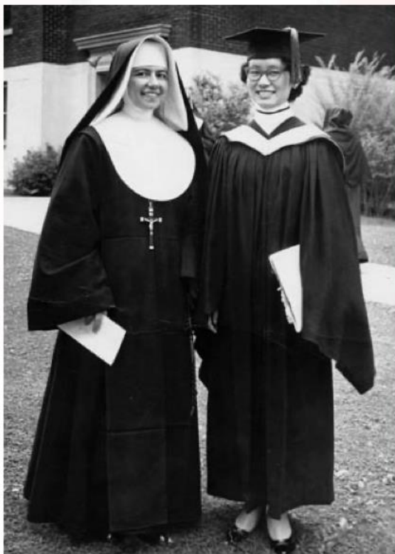
1959年美國瑪利屋大學圖書館學碩士照