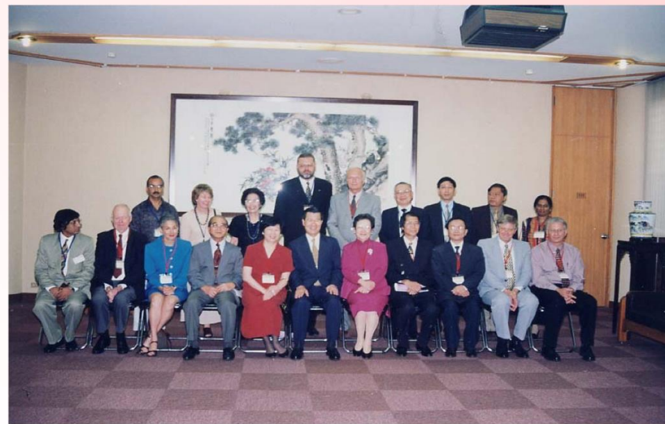
1999年8月18-20日中國圖書館學會同仁 與行政院蕭行政院長萬長合影