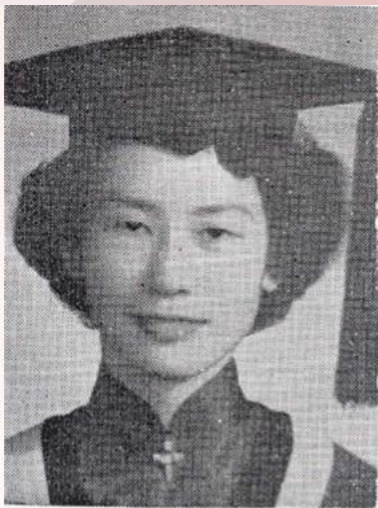
1955年台灣大學學士照