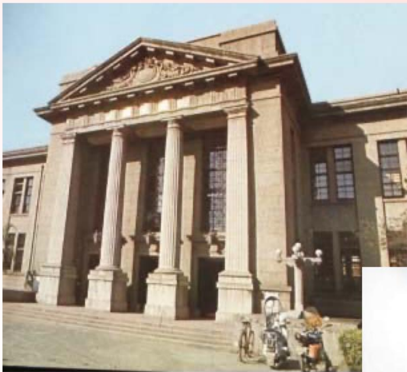
台灣師大圖書館舊館大門