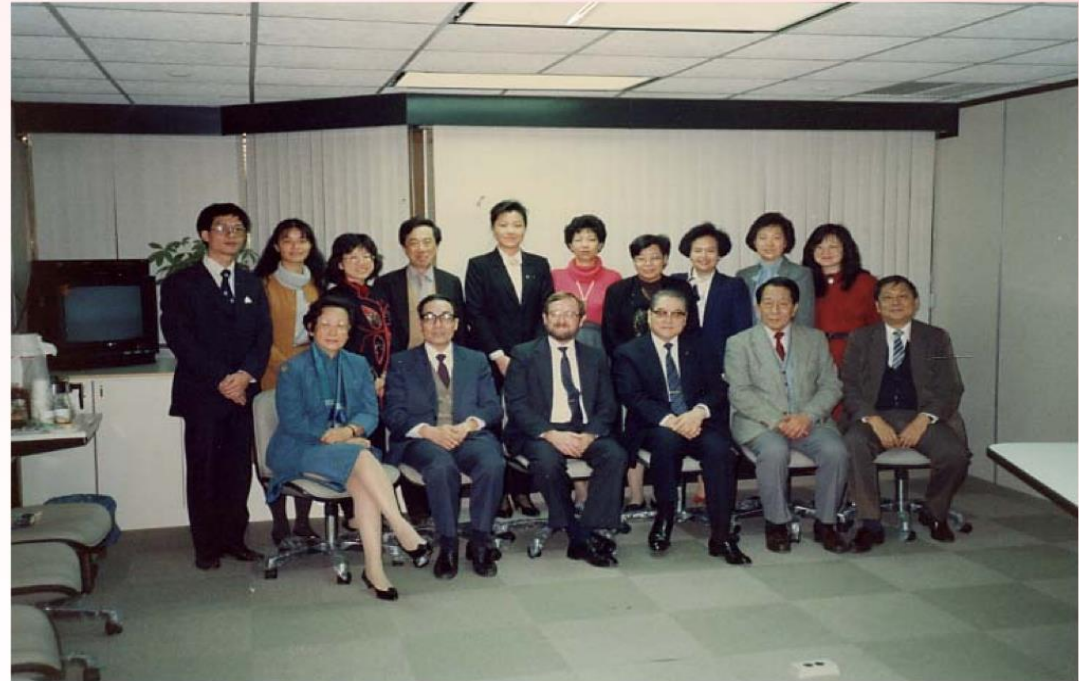
與各會員攝於1982年於科資中心舉辦之首屆 ASIS台北分會會議