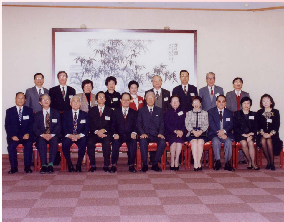
1998年12月2日中國圖書館學會同仁與李總統登輝合影