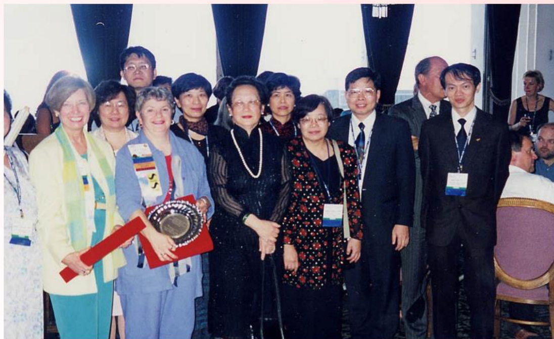
1999 年美國圖書館學會年會與會長 Sarah Long 及我國代表合影