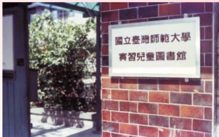
台灣師大兒童圖書館大門