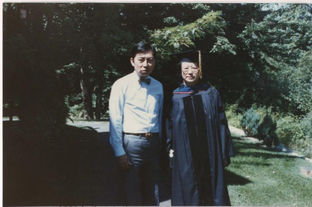
1983年美國印第安那大學資訊學博士學位照