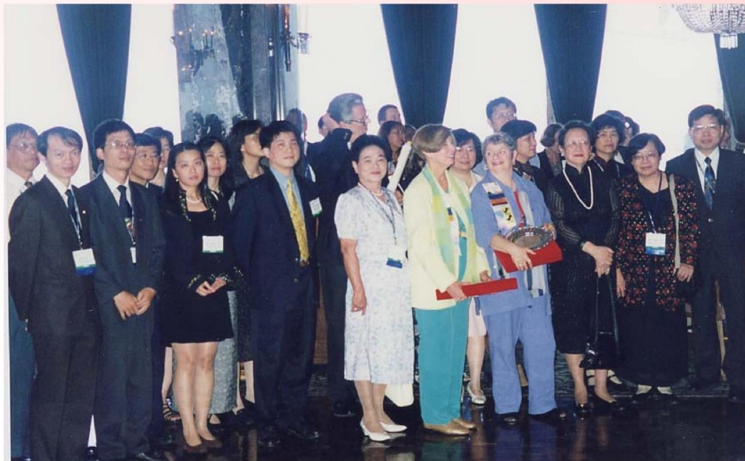
我國代表團與 108 屆 ALA 年會新舊任會長合影留念