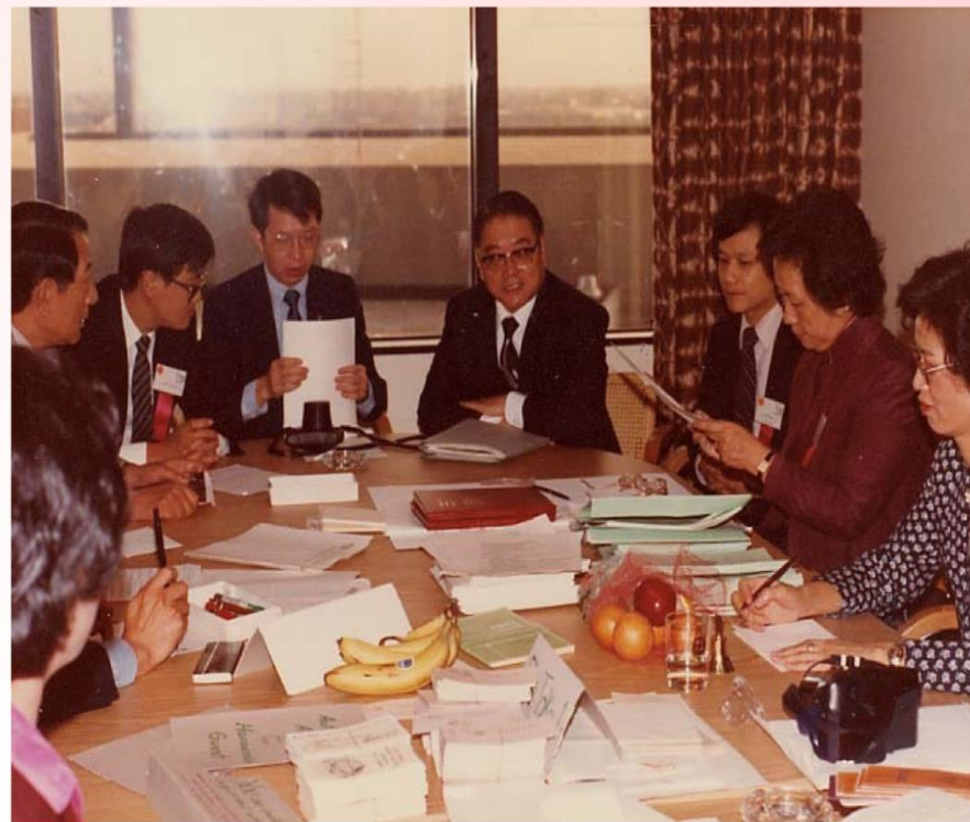
於1982年10月與國內圖書館學及資訊界專家，在參加美國 ASIS年會前，辦理中文資訊專題研討會籌備事宜時攝