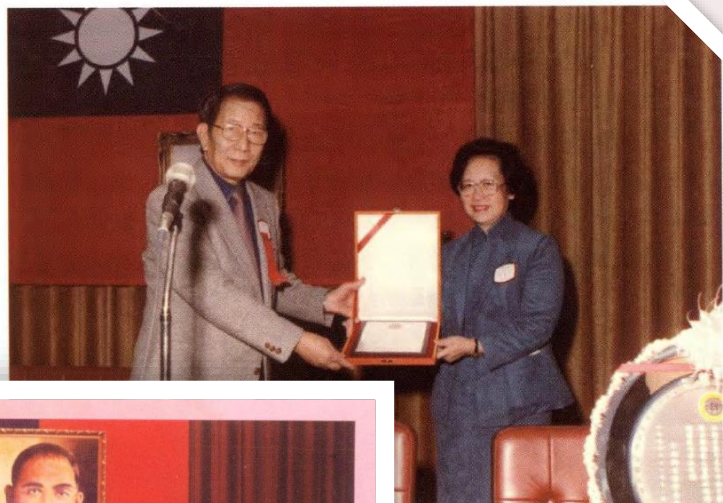
於民國68年及73年獲頒特殊服務暨貢獻獎