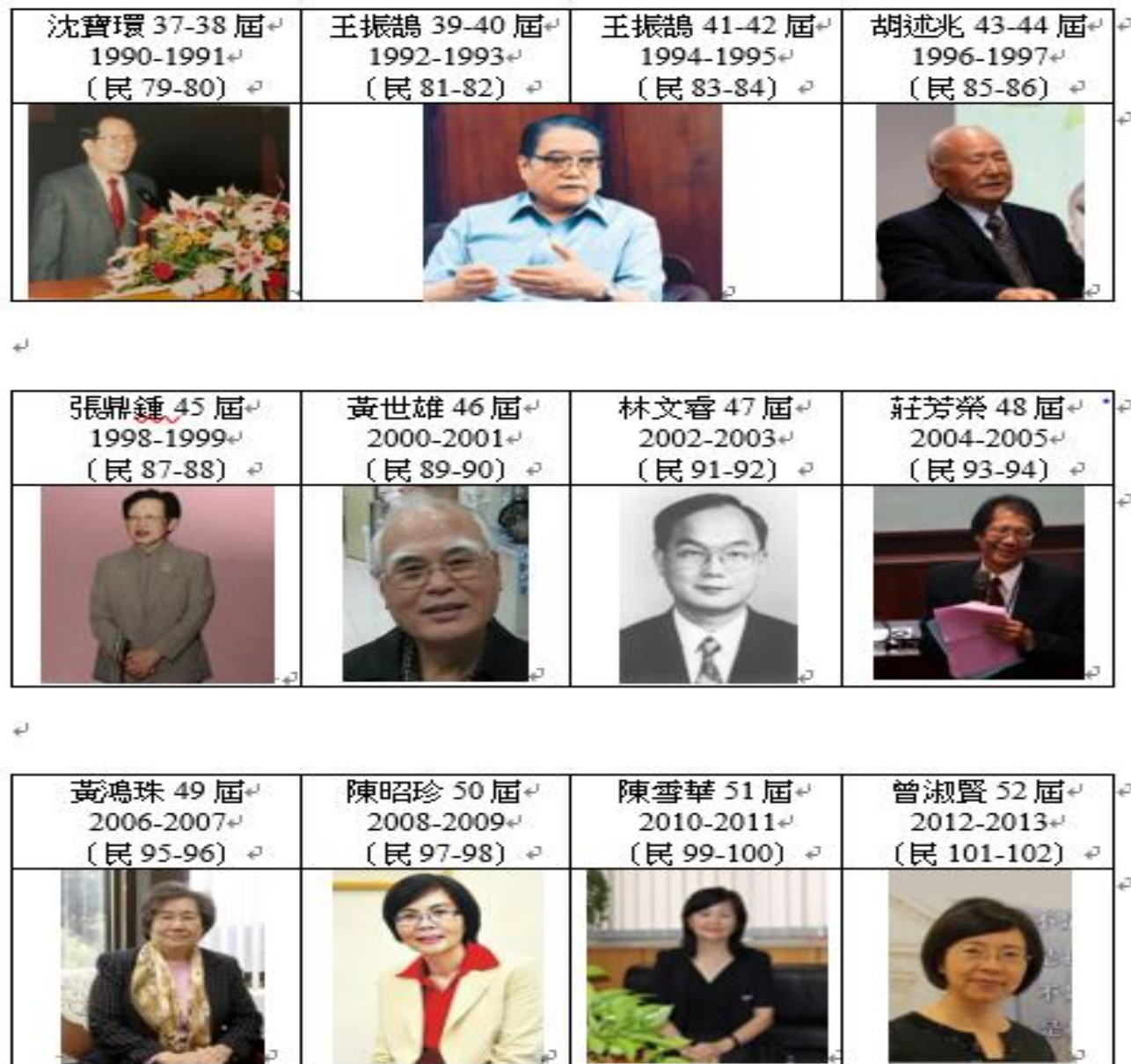
圖 2、中華民國圖書館學會歷屆理事長群英像

今逢學會七十周年會慶， 恭逢其盛，僅就前四位 理事長，敘說在他們理 事長時代對學會的貢獻