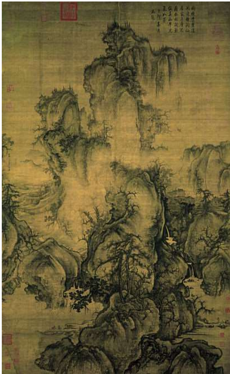
郭熙 (Guo Xi), 早春 (Early Spring), 1072 (Northern Song dynasty). National Palace Museum, Taipei. Hanging scroll.