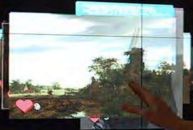
Landscape with a Windmill (1646) Jacob van Ruisdael ON VIEW IN GALLERY 213